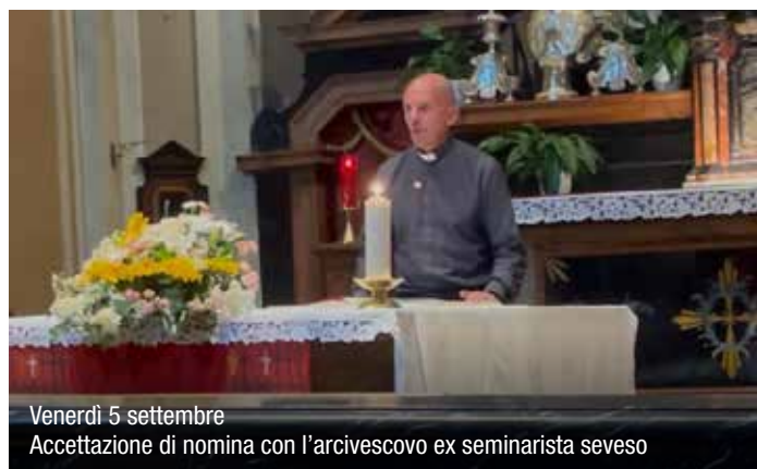
Venerdì 5 settembre Accettazione di nomina con l'arcivescovo ex seminarista seveso